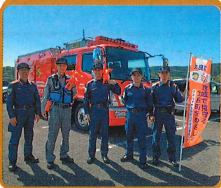
鹿島消防署太良分署