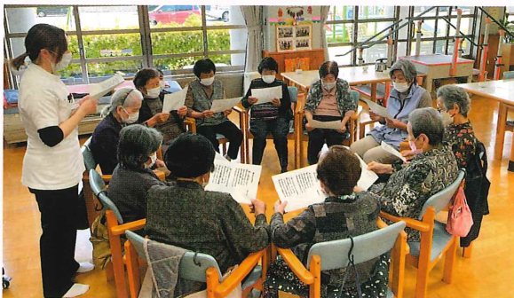
【脳トレ教室のようす】

介護保険の対象にならない比較的元気な高齢者を対象に、生きがいづくりを目的としたデイサービス(いきいき倶楽部)を実施しています。