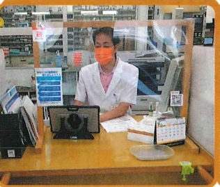
アルナ薬局太良店