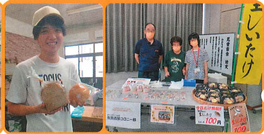
パン屋とあり様 佐賀西部コロニー様