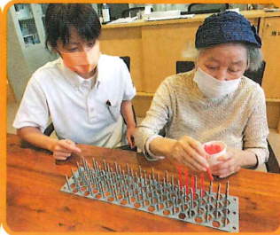
グループホームふるさとの森