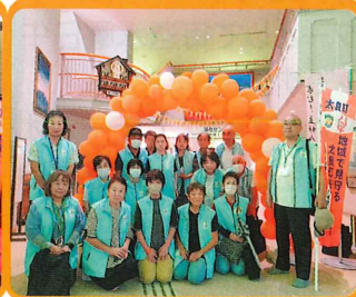
民生委員児童委員協議会