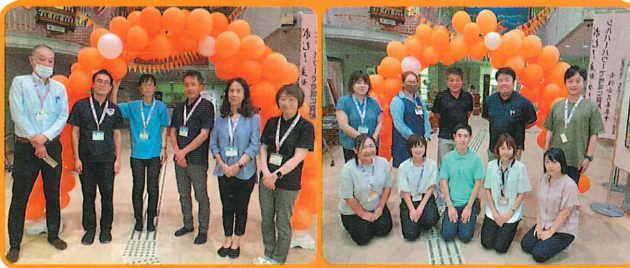
地域包括支援センター 社会福祉協議会