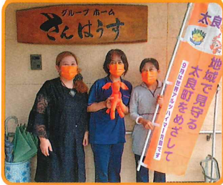
グループホームさんほうす