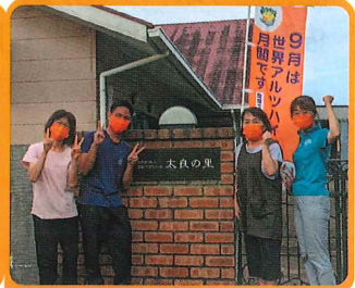
グループホーム太良の里