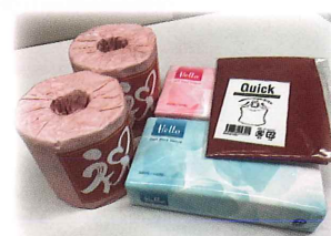
ティッシュセットとエコバックを届けました。