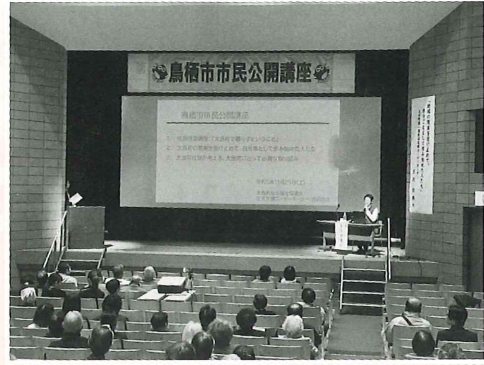
鳥栖市市民公開講座 (R5.11.25)

太良町内でもたくさんの方が受講され、口コミで広がっている超高齢社会に住民自身が主体的に備えることの大切さをまとめた講座「太良町で暮らすということ」について、町外・県外からの問い合わせがあり職員が出向き出前講座を行っております。ご視聴いただいた多くの方々から好評をいただいております。