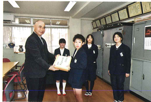
多良小学校ボランティア委員会様