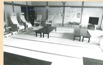
憩いの間（ハストロ設置）