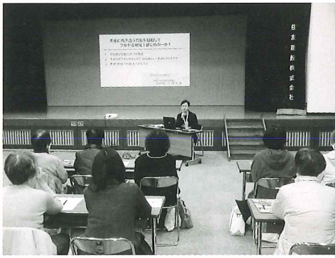
吉野ヶ里まちづくりボランティア講座 (R6.2.3)